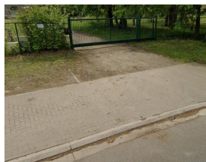
Met de fiets