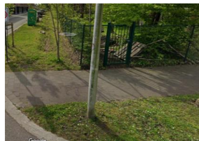
Met de auto/ te voet

activiteiten gaan doorsnee door van 14h tot 17h op het scoutsterrein. Kinderen die met de auto of te voet komen, mogen langs het kleine poortje in de Eekstraat, en zij kunnen hier ook weer opgehaald worden. Kinderen die met de fiets komen, mogen langs de grote poort, in de scoutsstraat 55. Als de activiteiten op een andere locatie, of op een andere plaats doorgaan, zullen jullie dit altijd terug vinden op de maandbrief. Lees dus zeker eens na op de website ( https://www.scoutsengidsenzele.be/activiteiten/brieven )